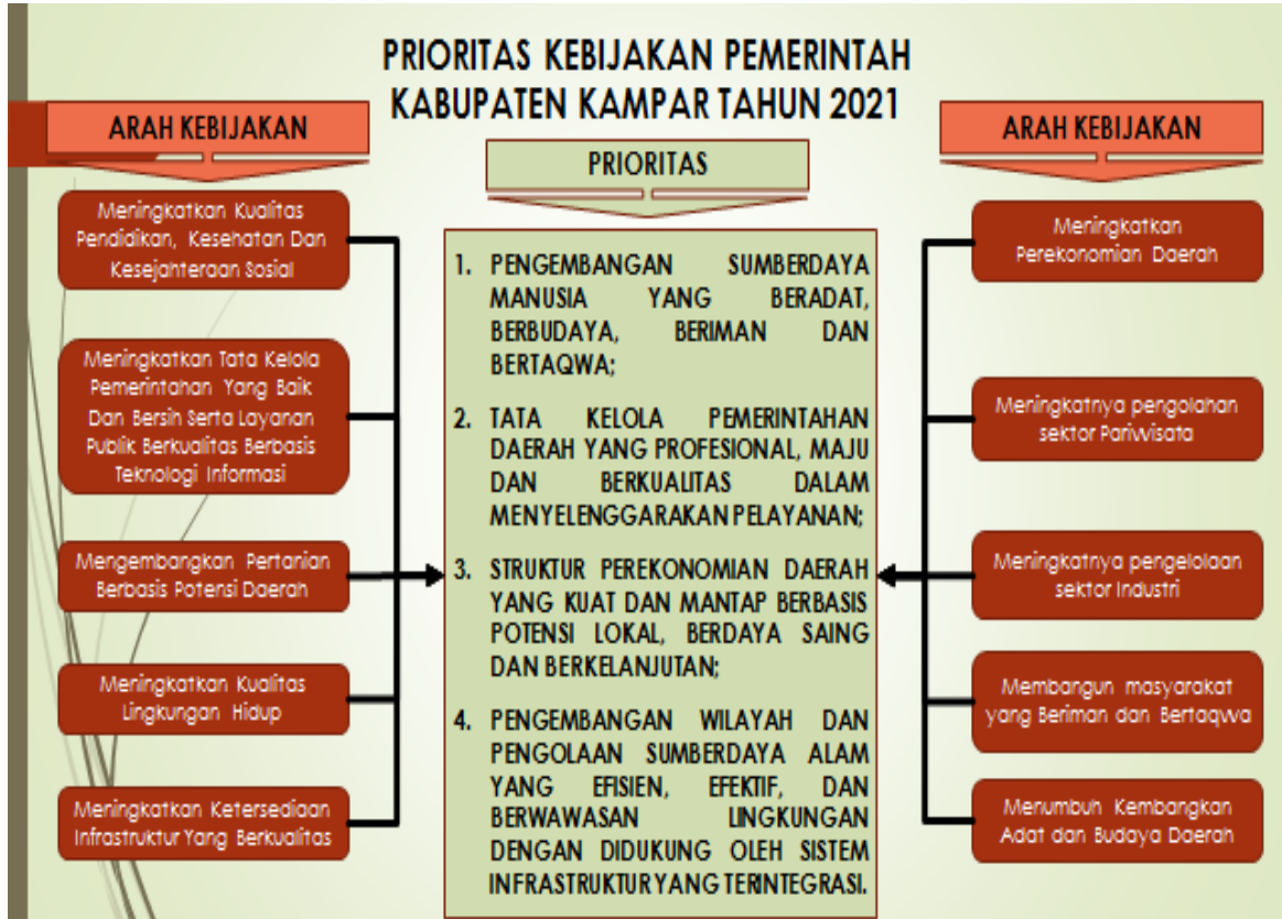
Gambar 4.1. Hubungan Prioritas dan Arah Kebijakan RKPD Kabupaten Kampar Tahun 2021

Skala Prioritas Pembangunan dalam RKPD Kabupaten Kampar Tahun 2021 tetap berpedoman pada skala prioritas Tahap Ke-4 RPJPN 2005-2025 (RPJM 2020-2024). Skala prioritas tersebut adalah sebagai berikut :