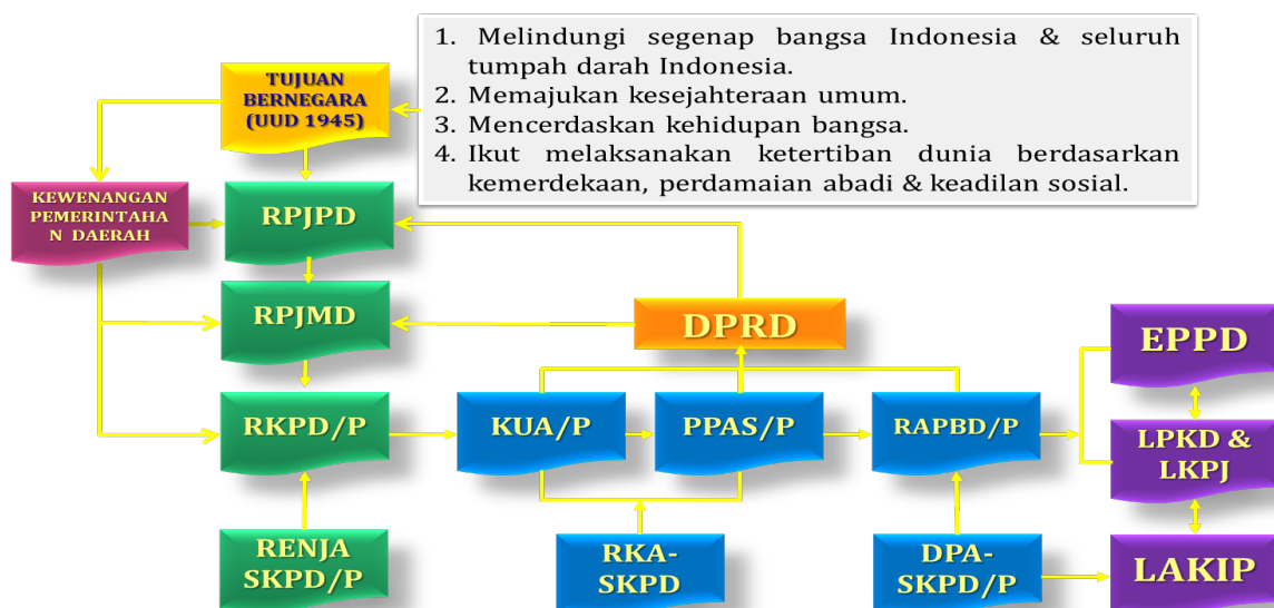
Gambar 1.1 Sistematika Alur Perencanaan dan Penganggaran

Secara garis besar hubungan antara Perubahan Rencana Kerja Pemerintah Daerah dengan produk-produk perencanaan pembangunan daerah yang lain dapat digambarkan dalam bentuk diagram berikut.